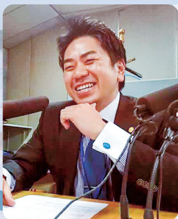
山元経営診断事務所 / 中小企業診断士

創業塾のカリキュラムを一定以上受講された方は、特定創業支援等事業を受けたものとして修了証を発行します。 本支援を受けた創業者には、創業時に 優遇措置 が適用されます。