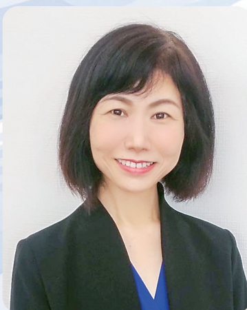
税理士法人アイビーパートナーズ代表社員

郡城市出身の中小企業診断士。 実家百貨店(創業65年)の後継者として経営実務を10年間経験して独立。これまでに2,100社以上の創業・新事業展開・事業承継・経営戦略の策定を支援している。 一級販売士・一級カラーコーディネーター・ITコーディネーター。